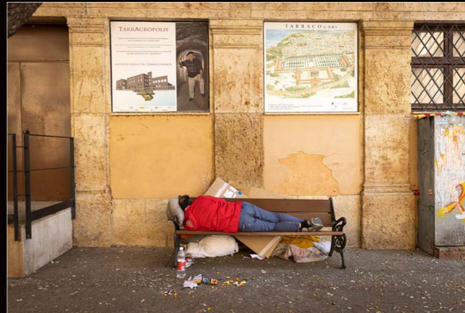
Fotografia Finalista David Oliete

El Refugi 1 del Moll de Costa del Port de Tarragona acull, entre el 4 de juliol i el 25 d'agost, l'exposició "Premi de Fotoperiodisme Camp de Tarragona", que reuneix les fotografies presentades a la XXXVI edició (2023) del Premi de Periodisme Mañé i Flaquer.