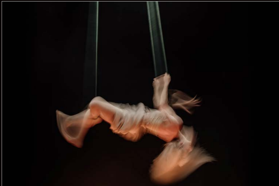
Fotografia Guanyadora Laia Solanellas