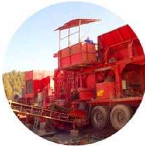
Planta de reciclatge de runes

Cal tenir en compte que bona part dels elements que configuren les construccions contemporànies poden ser reutilitzats. El reciclatge és el procés pel qual a partir de materials procedents dels residus que es generen en la construcció i demolició s'obté un producte valoritzable que és apte per a ser reutilitzat com a primera matèria. Els materials d'origen petri es poden reincorporar al cicle productiu mitjançant un procés de trituració i garbellament.